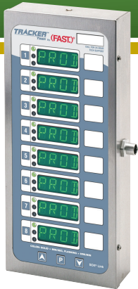
型号 81 (8 个显示屏)