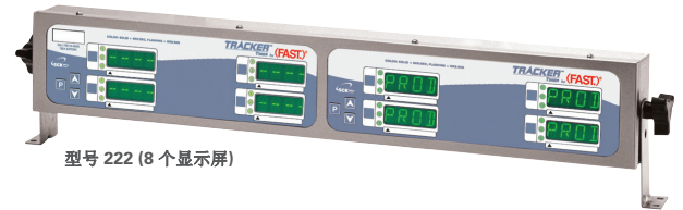
型号 222 (8 个显示屏)