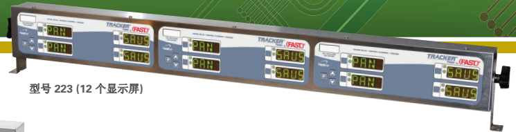
型号 223 (12 个显示屏)